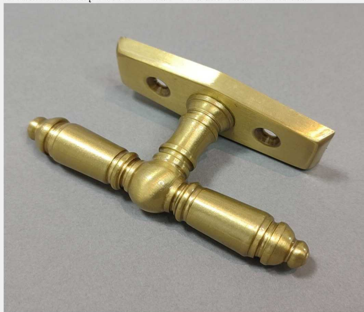
KLAMKA MOSIĘŻNA DO OKNA - 2 RAMIENNA - SATYNA